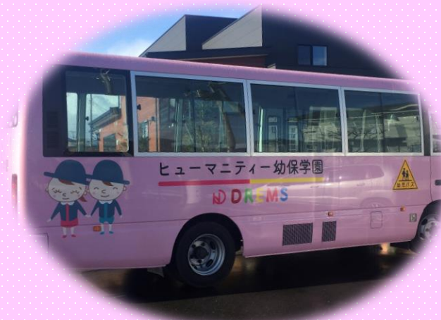
かわいいバスがお迎えに来てくれます