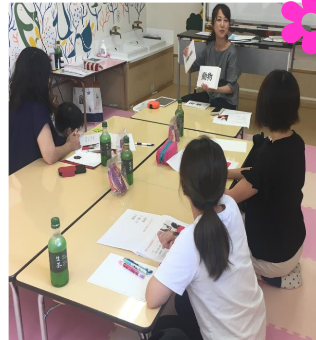
対面ママティーチャー講座