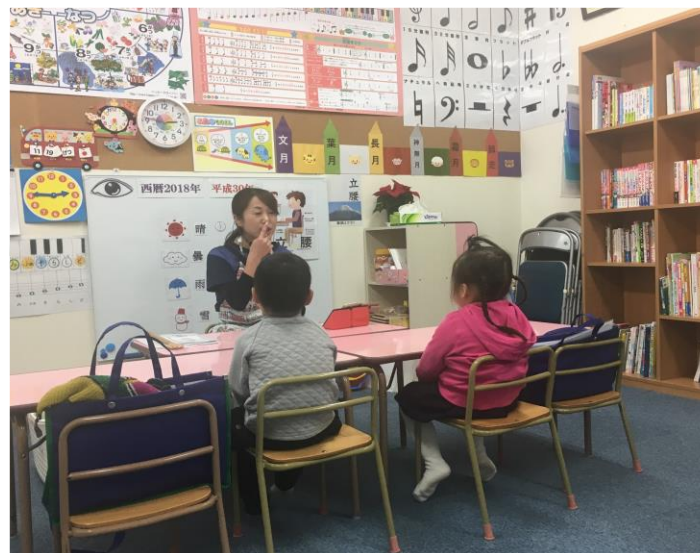
先生のおはなしに集中!!