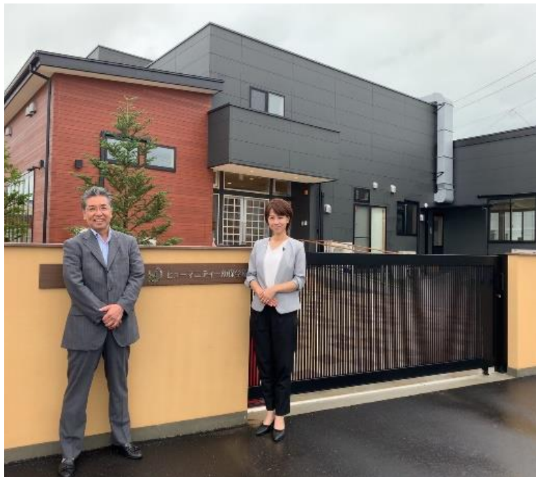
きれいな園舎で園長と理事長