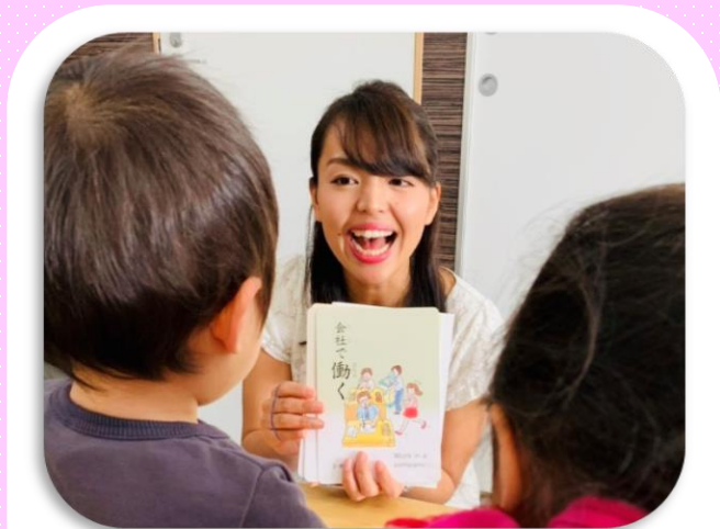
カードフラッシュ取り組み