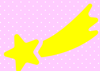
子どもたちの目はキラキラ☆