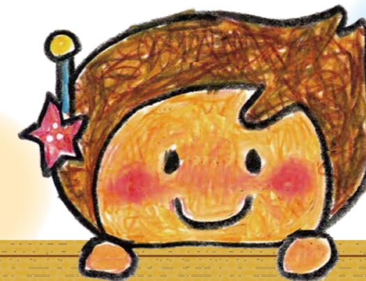
イメージキャラクター きらら